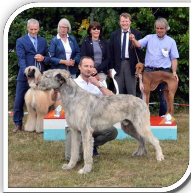
BIS 2017 - Labyrinth du Grand Chien de Culann