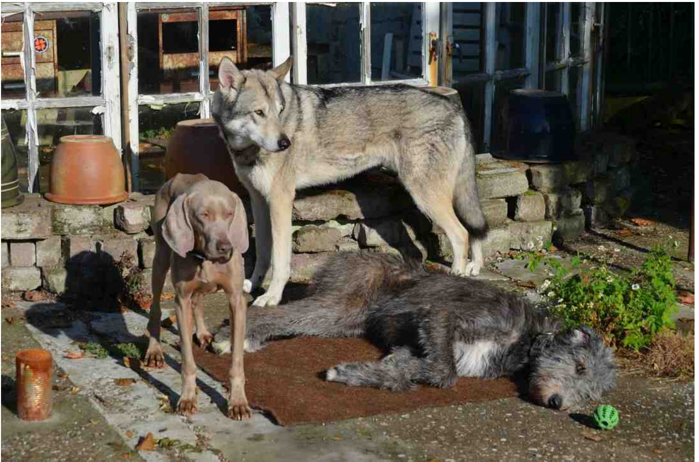
Met Mouse erbij